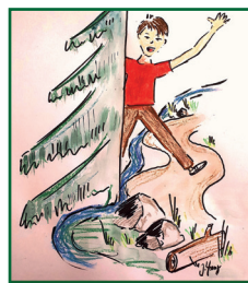
WILDER SASBACH ÜBER STOCK UND STEIN