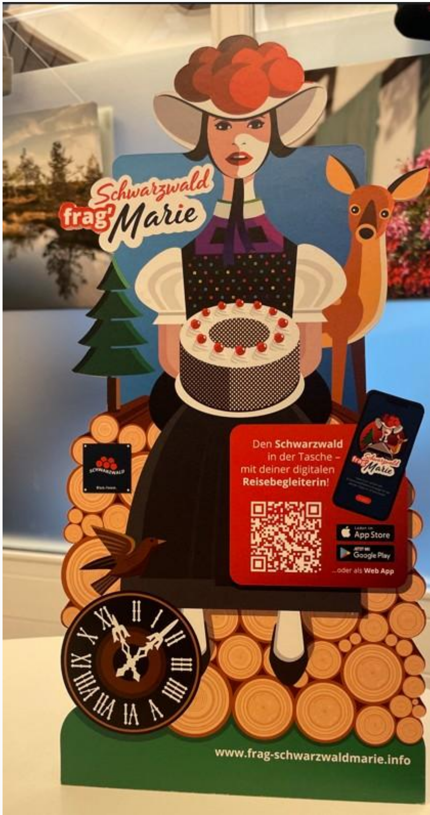
„Frag Schwarzwaldmarie“ Aufsteller für Ihren Empfang